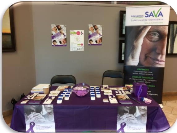
Table du Haut Saint-Laurent